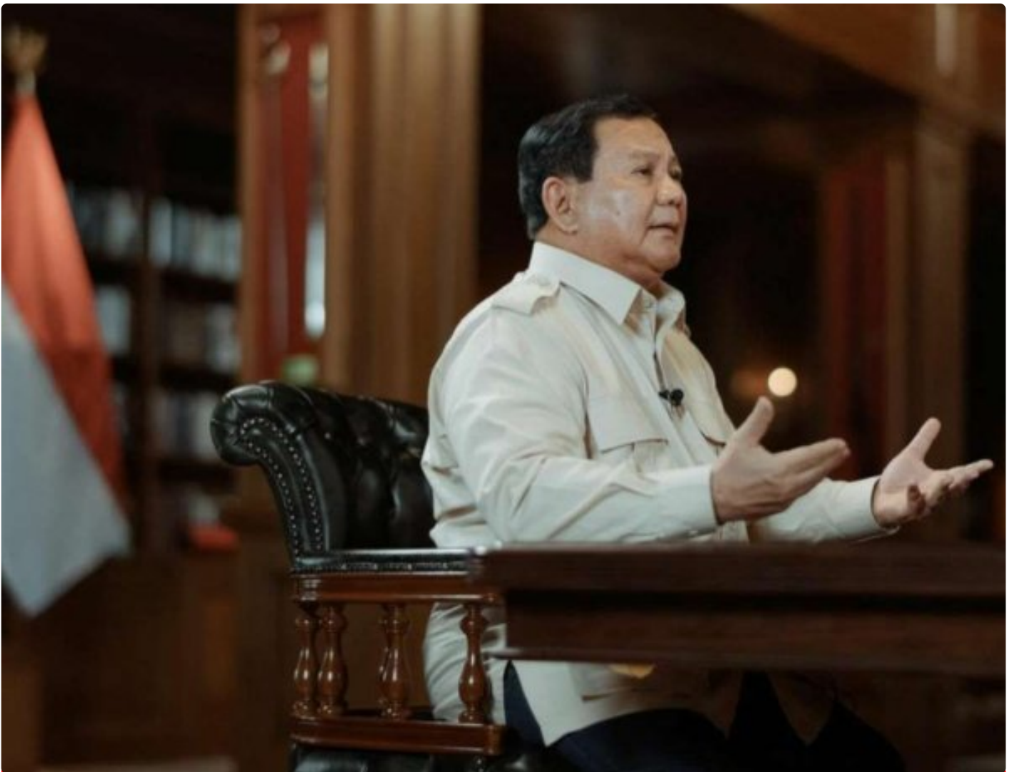
Prabowo Subianto Presiden RI 2024-2029

PENDIDIKAN - Indonesia dikenal sebagai negara yang kaya akan sumber daya alam. Dari hasil tambang yang berlimpah, laut yang luas dengan kekayaan hayati yang melimpah, hutan yang menjadi paru-paru dunia, hingga sumber daya energi yang tersebar di berbagai wilayah, semuanya menjadi kekuatan besar bagi bangsa ini. Potensi besar tersebut seharusnya dapat dimanfaatkan untuk